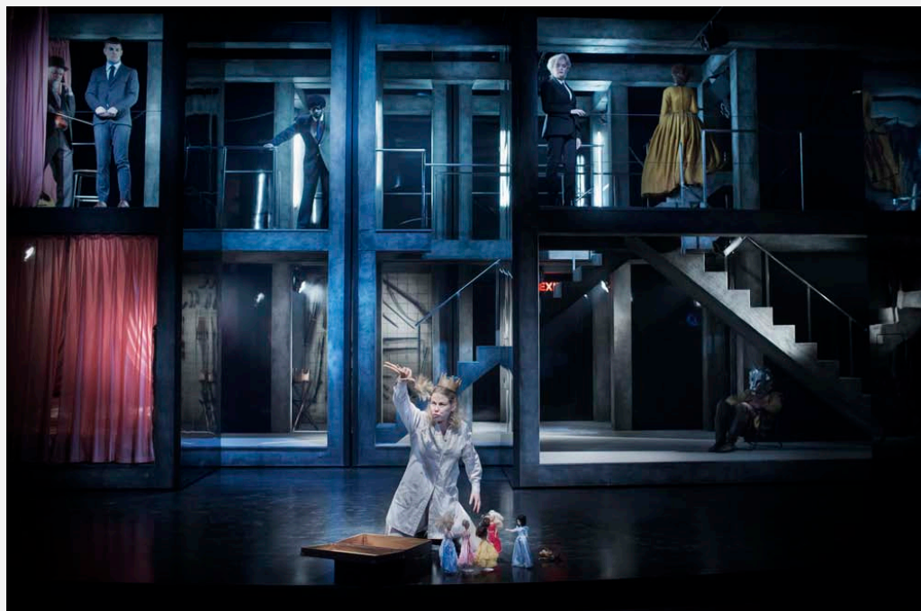
Östgötateatern, Dissekering av ett snöfall , foto Markus Gårder

– Det är väldigt kul och spännande. Jag ser på projektioner som ljus och inte bara som en stor skärm i bakgrunden. Det kan bli väldigt effektivt och du kan få rörelse i ljuset på ett helt annat sätt, säger belysningsmästaren och ljusdesignern Linn Persson.