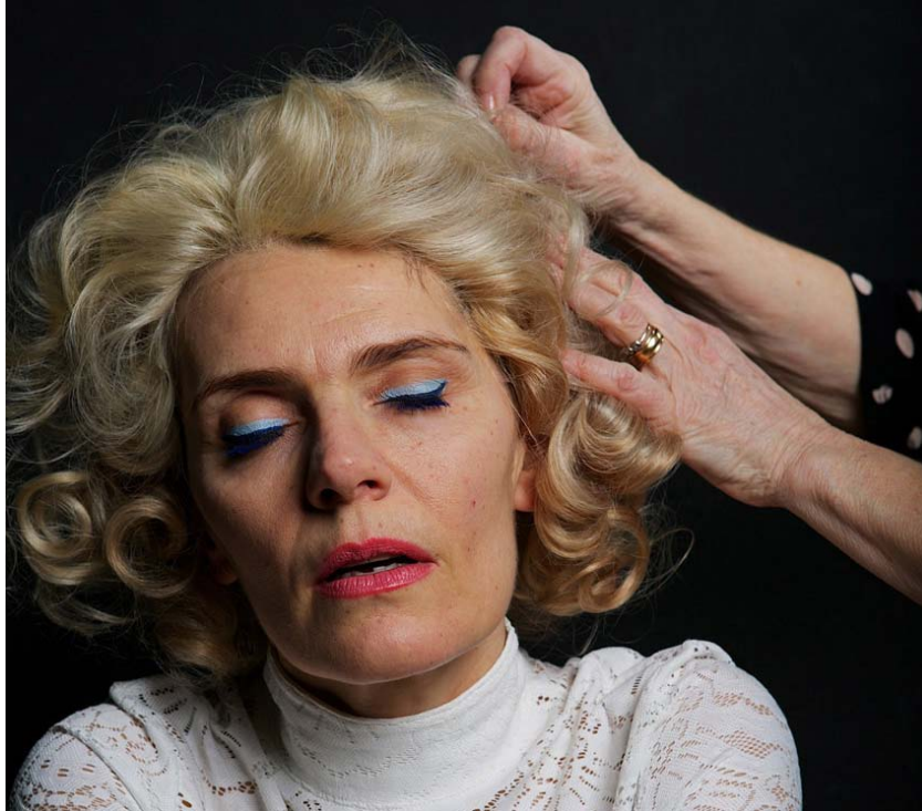
Folkteatern i Gävleborg, Projekt Mamma

Under våren arrangerar Folkteatern Gävleborg och Gefle Dagblad två pjäscirklar. Den 2 februari och den 23 mars bjuder vi in till öppna publiksamtal kring utvalda teaterpjäser, tillsammans med Folkteaterns ensemble. Den valda pjäsen läses in av skådespelarna och kommer finnas att lyssna på via Folkteaterns podcast innan samtalet.