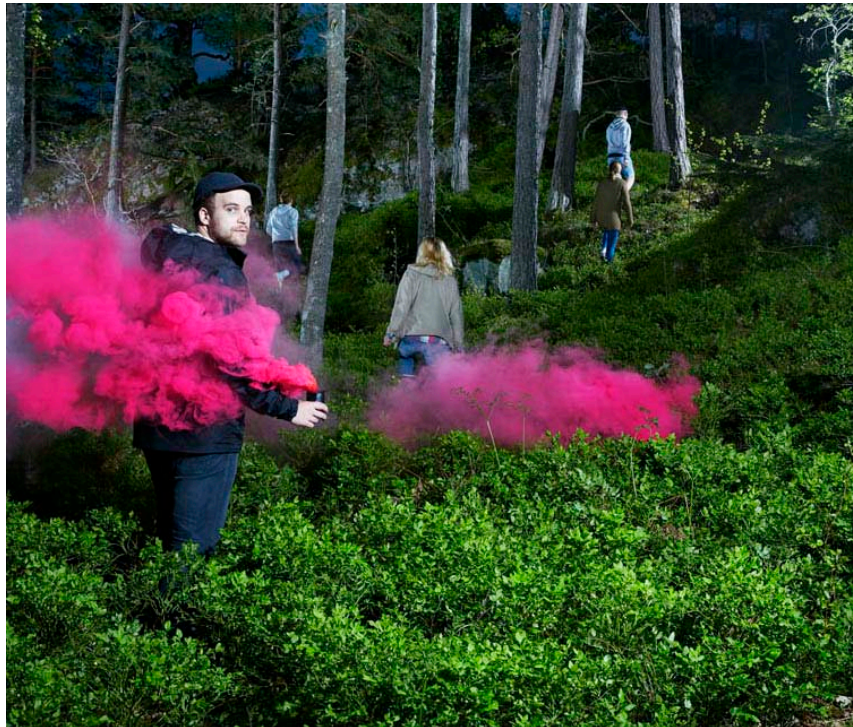
Folkteatern i Gävle, Landet inuti