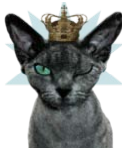
S*Munditia Devon Rex , bild av Tone Aminda Lund