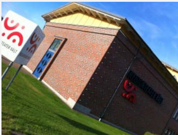
Regionteater Väst Teater, Uddevalla