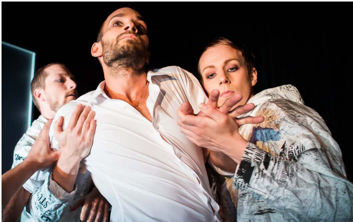
Superhjältar och förbjuden frukt, Regionteater Väst Dans, foto Håkan Larsson

Det är dagen efter säsongens första premiär, Superhjältar och förbjuden frukt , på Regionteater Västs dansscen i Borås. Morgonens tidning går prasslande runt i otåligen händer. Alla vill läsa.