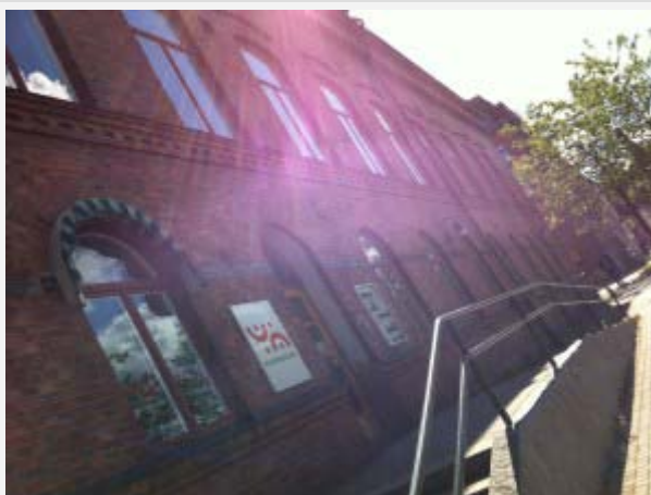
Regionteater Väst Dans i Borås