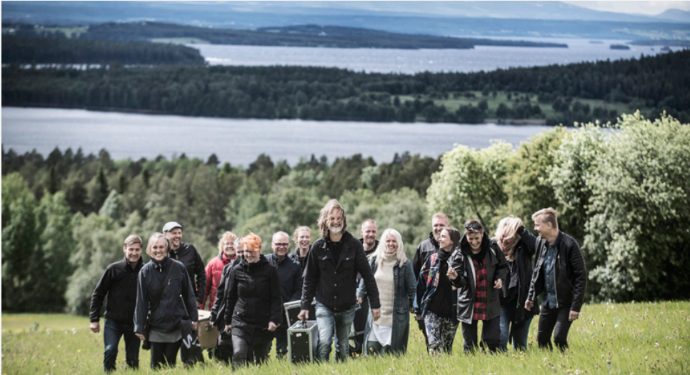
Här kommer Estrad Norr!