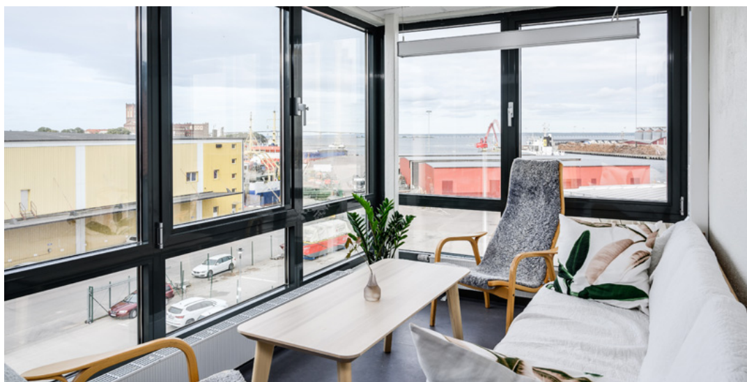
Byteatern Kalmar Länsteater, foto Jean-Pierre Valpiani

Scenerna är byggda som blackboxar, den stora tar nästan 200 personer i publik och har en motoriserad teleskopplåtare och en ledbaserad ljusrigg. Den lilla tar 100 personer och det som förr var lilla scen är nu replokal. Båda scenerna har dansanpassade golv.