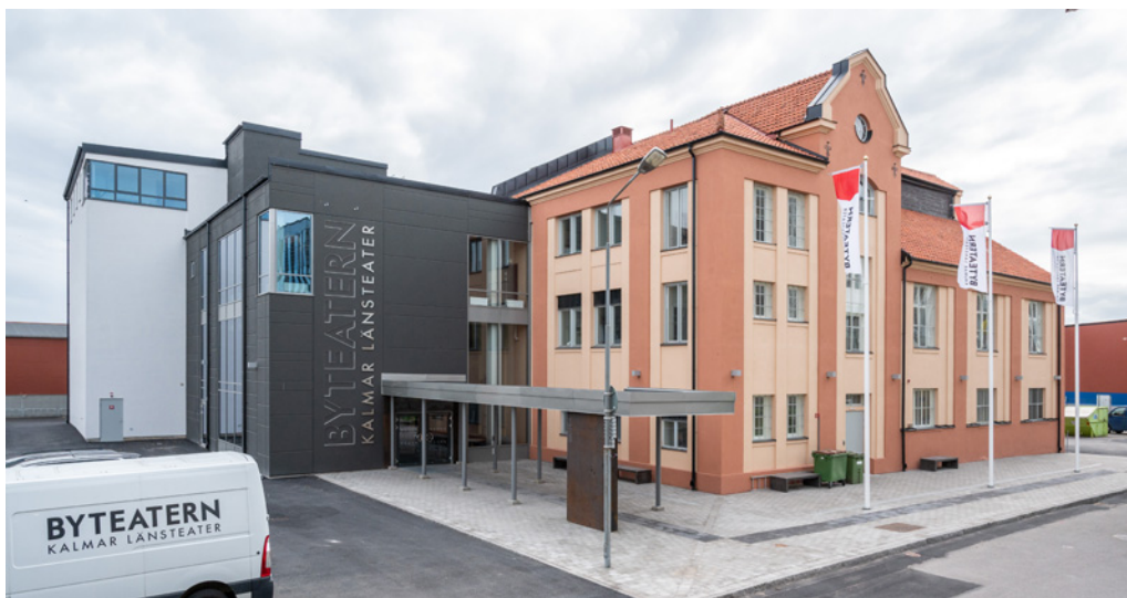
Byteatern Kalmar Länsteater