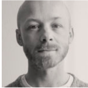
Måns Winge