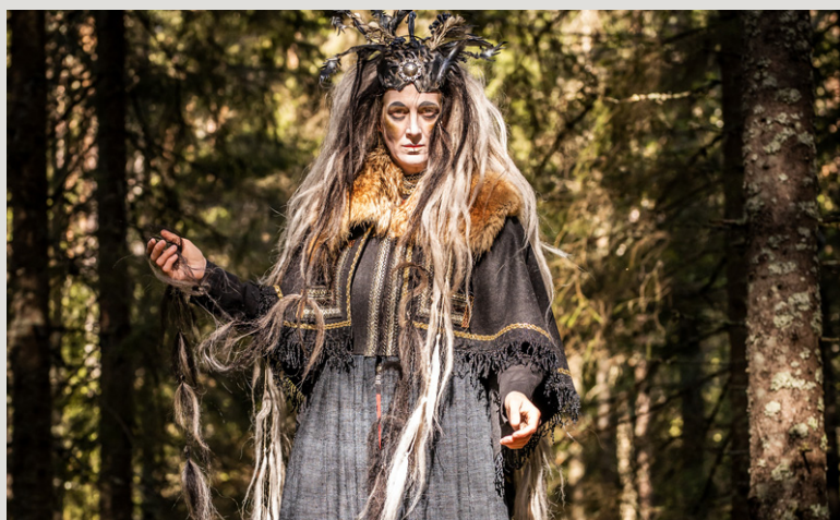
Den poetiska Eddan spelas på Västana Teater

Ingen sommar utan sommarsteater! Packa filten, termosen, myggmedlet och paraplyet - länsteatrarna erbjuder ett rikt utbud för den som är sugen på en scenkonstupplevelse i det gröna. Här får du några tips!