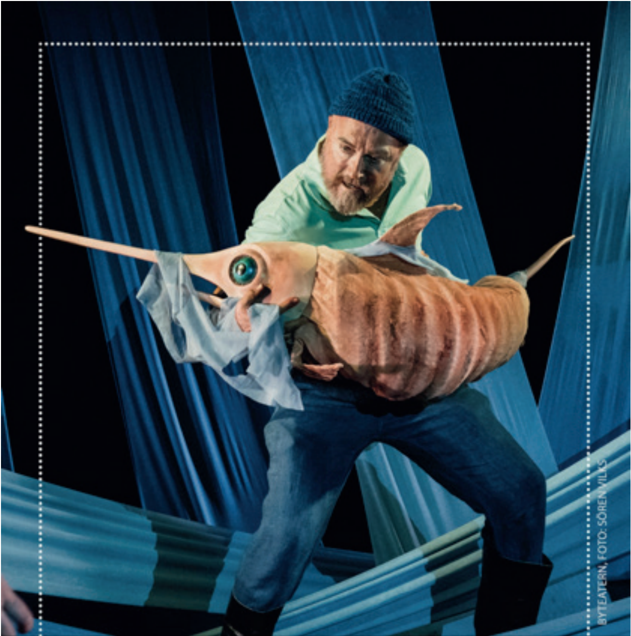
BYTEATERN, FOTO: SÖREN VILCS