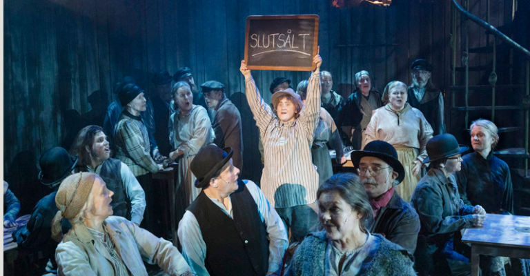
Sweeney Todd på Dalateatern, foto Per Eriksson

Dalateatern sätter upp Sweeney Todd i ett samarbete med Dalasinfoniettan och inte en ledig stol finns att uppbunga. Östgötateatern spelar musikalen Rocky Horror Show för fulla salonger på Stora Teatern i Linköping. På Smålands Musik och Teater lockade On the town en stor publik under hela hösten 2018 och där visar ny statistik att av förstagångsbesökarna som kommer för att se en musical återvänder så många som en fjärdedel för att se något annat på repertoaren.