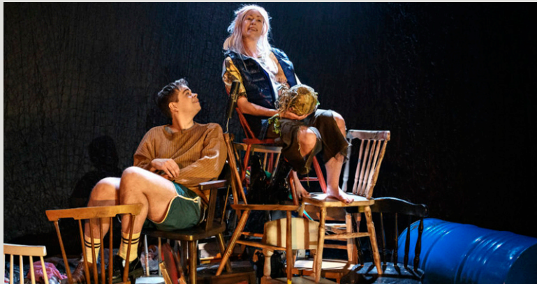
Fyra spänn City, Teater Västernorrland

I Fyra spänn City samlas alla som inte har råd att bo i den vanliga staden. Varje invånare får fyra kronor per dag att leva på. Problemet är bara att alla varor i den enda butiken kostar just fyra spänn styck. Föreställningen som riktar sig till alla över 9 år har premiär den 26 mars på Teater Västernorrland. Fyra spänn City har tagits fram tillsammans med klass 5 på Hellbergsskolan i Sundsvall som ett led i Teater Västernorrlands nya arbetssätt Kreativa Klasser. Vi passade på att ställa några frågor till regissören Kristoffer Berglund!