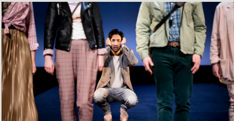
100 sönger på Örebro länsteater