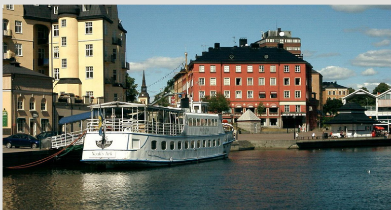
Oktoberteatern, mitt i Södertälje.

Oktoberteatern och Länsteatrarna i Sverige hälsar länsteaternas styrelseordförande, vice ordförande, vd, scenkonstchefer och konstnärliga ledare välkomna till vårmöte på Oktoberteatern i Södertälje 27-29 mars. Temat för mötet är "Länsteatrarna i Sverige". Vi fokuserar på Länsteatrarna i Sverige som förening, diskuterar vilka frågor vi ska driva framöver och på vilket sätt vi ska arbeta för att stärka Sveriges länsteaterns ställning, villkor och förutsättningar. Vi får besök av kulturminister Amanda Lind och vi ser verkligen fram emot att prata med henne om länsteaternas situation!