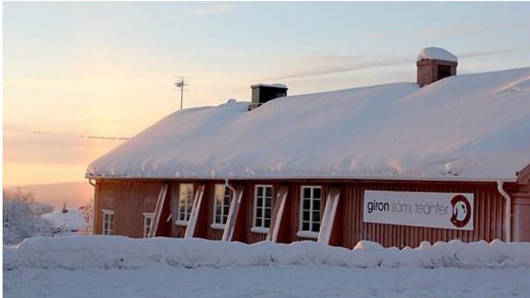
Giron sámí teáhter

Samisk teater i Sverige startades genom teatergruppen Dálvadis som etablerades i Jokkmokk 1971 och upplöstes 1991. Därefter etablerades Föreningen Samiska teatern som idag heter Giron sámí teáhter och är en turnerande institutionsteater med huvudsäte i Kiruna samt en viss verksamhet för ungdomar i Tärnaby. 1992 fick teatern sina första statliga anslag som distribueras via sametinget. Övrig finansiering kommer ifrån landstinget i Norrbotten, region Västerbotten samt Kiruna och Storums kommuner. Giron sámí teáhter är organiserad som en ideell förening vars medlemmar till största delen består av sameföreningar och samiska organisationer.