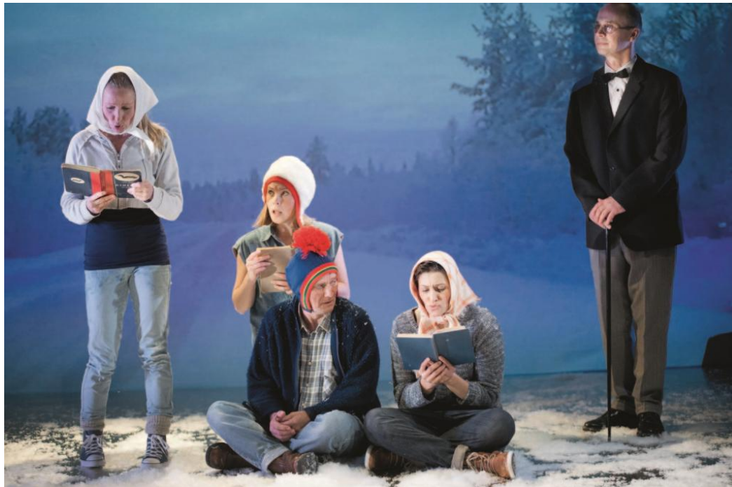
När vinterns stjärnor lyser här

Giron sámí teáhters uppgift är att förmedla berättelser som tar sitt avstamp i den samiska kulturen och historien för att den dimensionen också ska finnas i vårt gemensamma medvetande. Teatern har, i sin nuvarande form, funnits i 21 år och är, ur samiskt perspektiv, en ny organisation och en ny konststart som fortfarande är under utveckling. För att kunna producera och framförallt, turnéra i Sápmi och stora delar av Sverige är teatern idag mycket beroende av föreställningsintäkter och sökta extra anslag vilket gör hela organisationen sårbar. Ett arbete pågår med att förändra grundorganisationen och den finansiella basen.