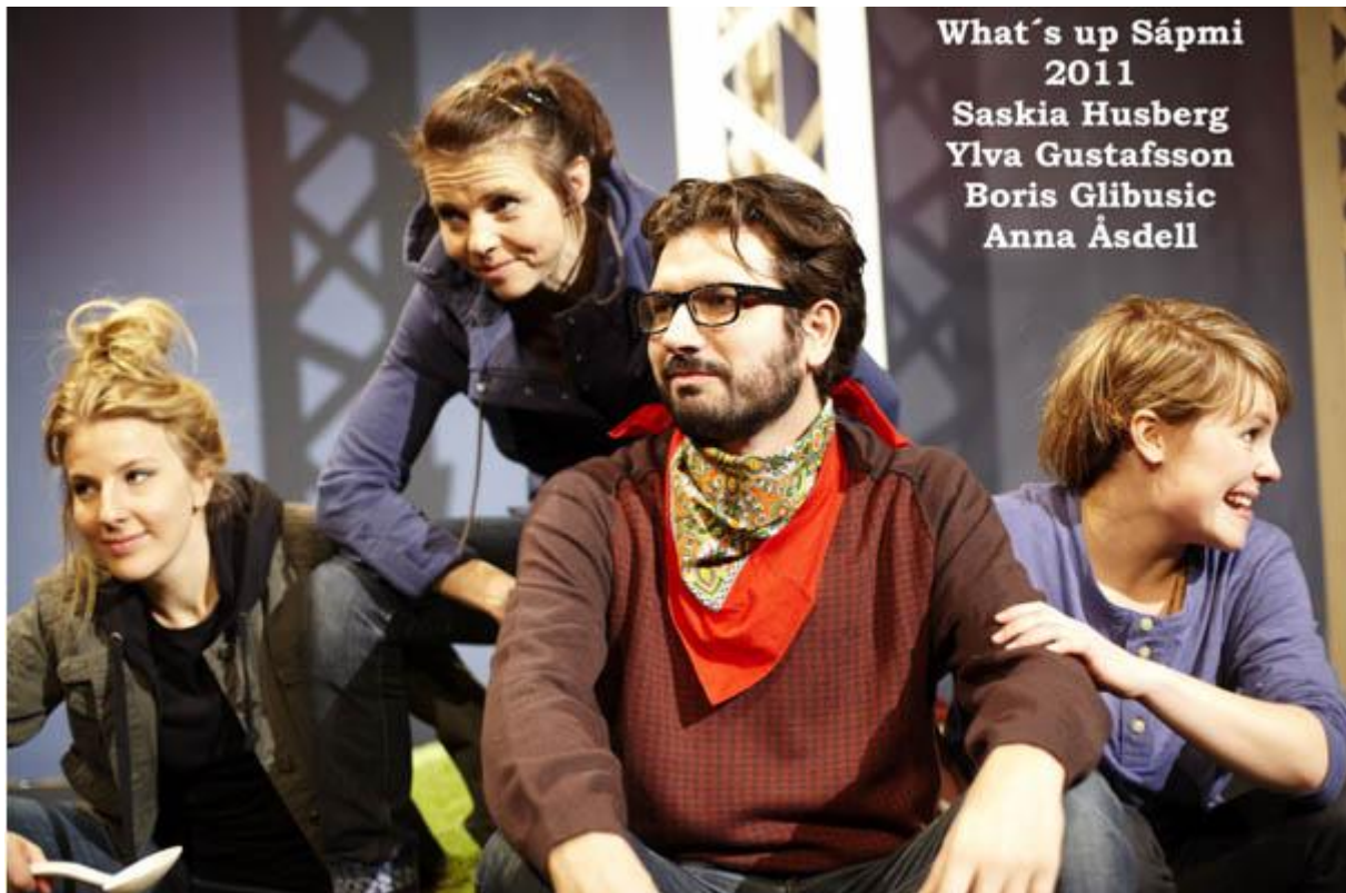
What's up Sápmi, Giron Sámi Teáhter

Under kulturhuvudstadsåret 2014 i Umeå är teatern inblandad i flera större samarbetsprojekt. Framförallt produktionen Jag är tusen år , ett nyskrivet manus av Erik Norberg där våra samarbetspartners är den norska samiska teatern, Beavivvas sámi nasunálateáhter, Dramaten, Norrbottensmusikens NEO samt Norrlandsoperan. Föreställningen ingår i projektet Rock-Art in Sápmi som drivs av Västerbottens museum. I det projektet har vi haft seminarier och kunskapsutbyte under flera år med arkeologer o pedagoger från museet, Umeå universitet, Västerbottensteatern och ett flertal fria konstnärer. Jag är tusen år börjar när inlandsisen drar sig tillbaka från nordkalotten och slutar med kampen mot exploateringen av de samiska markerna och de kortsiktiga ekonomiska intressena inom gruvnäringen.