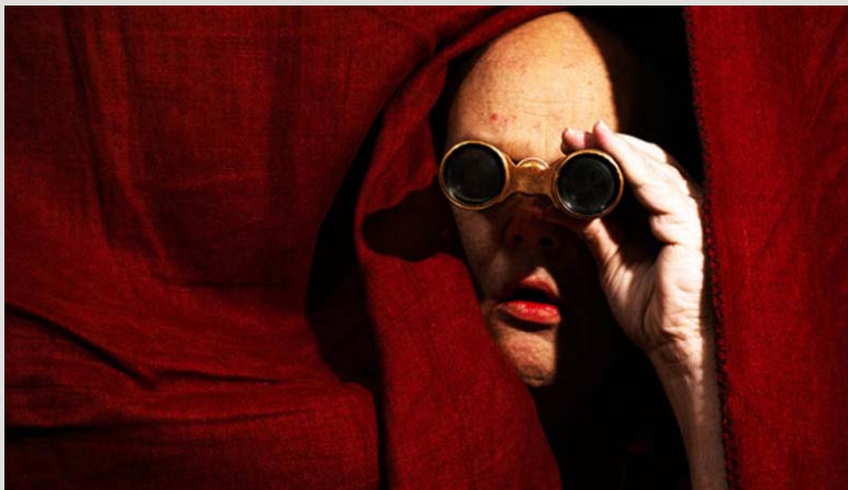
Teater Halland, Gud i kulissen

Konventet Folk och Kultur går av stapeln den 7–10 februari 2018. Precis ett år innan bjuder vi nu in till ett uppstartsmöte i Munktelstaden i Eskilstuna. Då går startskottet! Vi har ett år på oss. Alla som är intresserade av ett årligen återkommande kulturpolitiskt konvent och en tribun för konst och kultur i hela Sverige är hjärtligt välkomna.