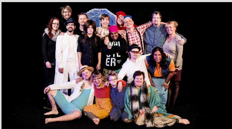
Teater Barda, foto Sandra Lee Pettersson

2017 är Teater Bardas tionde verksamhetsår som scenkonstgrupp. Det firas bland annat med föreställningen Bardas 10 budord som skall bli gruppens mest innerliga och utmanande scenkonststycke hittills.