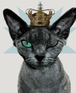
S*Munditia Devon Rex, bild av Tone Aminda Lund

På Länsteaternas hemsida finns rubriken "Fokus på". Denna gång riktar vi strålkastaren mot Folkteatern