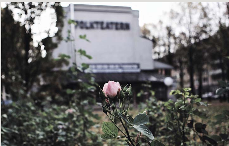
Folkteatern Gävleborg