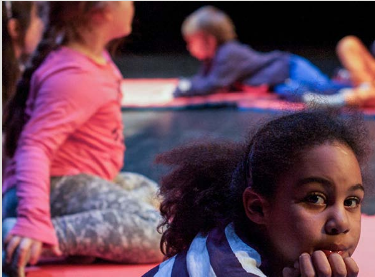
Från Oktober-teaterns verksamhet Embryo, en teaterlekstudio för lågstadiesbarn

Vi hälsar Oktober-teatern hjärtligt välkommen som ny medlem i Länsteatrarna i Sverige! Oktober-teatern bildades 1973 som en fri teatergrupp och är idag en mindre institutionsteater med fast scen i Södertälje. Oktober-teatern producerar scenkonst för främst barn och unga, vilket inkluderar verksamhet riktad till Södertäljes alla grundskoleelever samt till barnfamiljer, men också för vuxna.