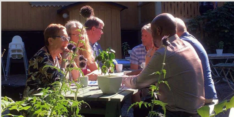
Samtal i solen på dialogmötet den 26 augusti

Länsteatrarna i Sveriges dialogmöten vänder sig framför allt till förtroendevalda och politiker i länsteatrarnas styrelser. På mötet den 26 augusti handlade det både om kulturpolitik på "en armlängds avstånd" och den eventuellt kommande regionbildningen där sex nya storregioner ersätter dagens länsindelning.