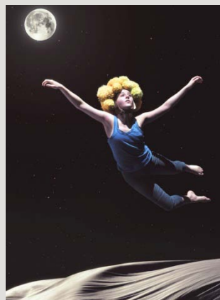
Lille prinsen, foto Bengt Wanselius

Norrdans föreställning Lille prinsen är utvald att visas på i ICE HOT i Köpenhamn 30 nov-4 dec som en av nitton föreställningar från hela Norden. Läs mer