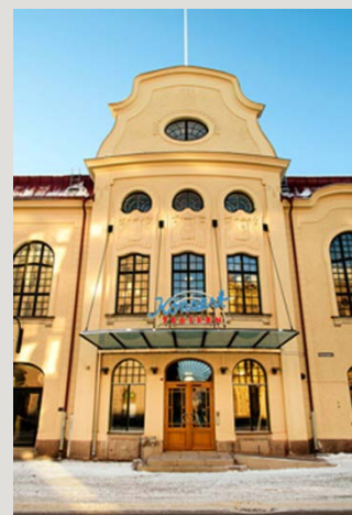
Konsertteatern i Sundsvall

Nu invigs Sundsvalls nyrenoverade teaterkvarter. På lördag 12 mars har