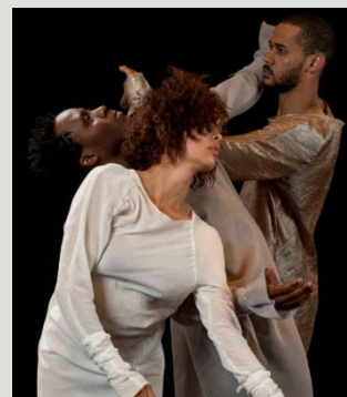
Adagio for a hacked life, Scenkonst Sörmland

Adagio for a hacked life är den sista delen i danstrilogin Growth, ett samarbete mellan Scenkonst Sörmland och Baxter Theater i Sydafrika. Denna gång handlar det om utbrändhet, arbetsnarkomani och ekonomisk tillväxt.