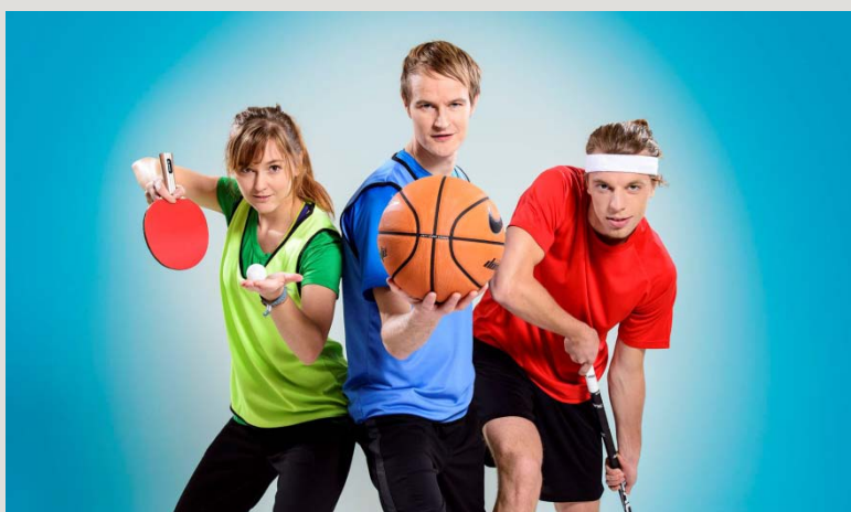
Bollkänsla , ett samarbete mellan Teater Västernorrland, Norrdans och Musik Västernorrland, spelas för asylsökande, foto Lia Jacobi

Hur kan scenkonst vara ett redskap för att arbeta tillsammans med nyanlända? Det undersöks på en rad länsteatrar just nu, exempelvis på Teater Västernorrland, Norrdans, Västmanlands Teater, Scenkonst Sörmland, ung scen/öst och Regionteater Väst. Arbetet med nyanlända öppnar upp för nya erfarenheter, samarbetspartners och en ny publik. Ett exempel är den språkoberoende föreställningen Bollkänsla , som är ett samarbete mellan Teater Västernorrland, Norrdans och Musik Västernorrland. Bollkänsla passar alla åldrar och spelas för asylsökande barn och deras familjer. Läs mer