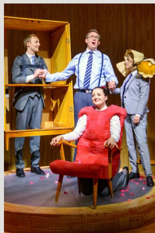
Just nu spelas föreställningen Ingvar, en musikalisk möbesaga på Teater Västernorrland