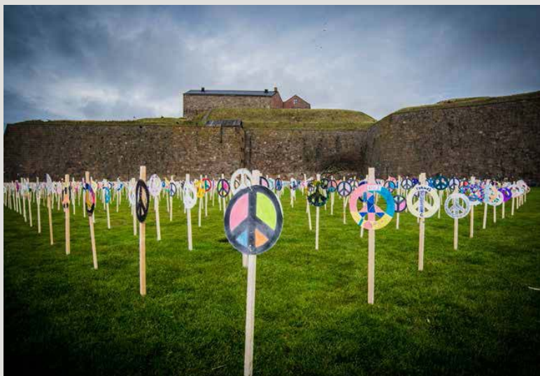
Skolklasser satte upp fredsmärken vid Varbergs fästning

Teater Halland initierade VARBERG CALLING for Peace - ett helt år av fredsarbete i Varbergs kommun 2015. Det var ett gigantiskt fredsprojekt som skapade nya möten, samarbeten och positiva synergier.