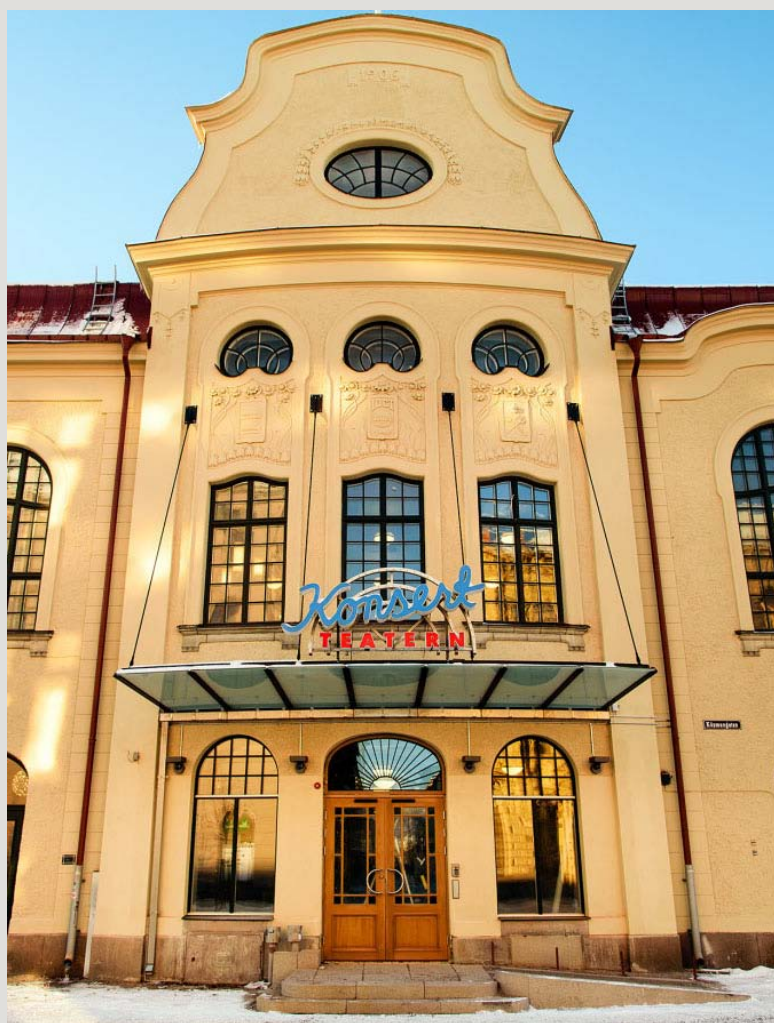
Länsteatrarnas vårmöte hålls på nya Konsertteatern i Sundsvall.

Länsteatrarna i Sverige och Teater Västernorrland bjuder in till vårmöte för medlemsteatrarnas styrelseordförande, vice ordförande, VD, teaterchefer och konstnärliga ledare den 13-15 april i Sundsvall, närmare bestämt i Scenkonst Västernorrlands och Teater Västernorrlands nya fina lokaler på Norra Järnvägsgatan.