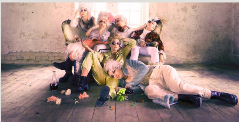
Vilka sitter på ledande positioner inom länsteatrarna 2015, tro? Bilden är från Örebro länsteaters föreställning Drottningens juvelsmycke, foto Mattias Ermanbri

I höstas fick Sverige en ny regering och nu ser vi konsekvenserna av de politiska förändringarna i våra styrelser. Styrelsen för Länsteatrarna i Sverige vill rikta ett stort TACK till alla er som under flera år har tillfört kunskap, engagemang, erfarenhet och kloka idéer för att stärka den regionala scenkonsten i hela Sverige!