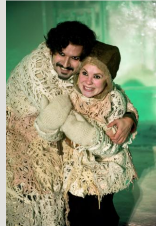
Giron sámi teáhter

Dialogmötena som Länsteatrarna anordnar i samarbete med Svensk Scenkonst och Länsmusikens samarbetsråd den 14 och 15 oktober i Växjö och Sundsvall är tyvärr inställda p.g.a. för få anmälningar. Det finns en chans att mötena arrangeras i Stockholm istället. Mer info kommer!