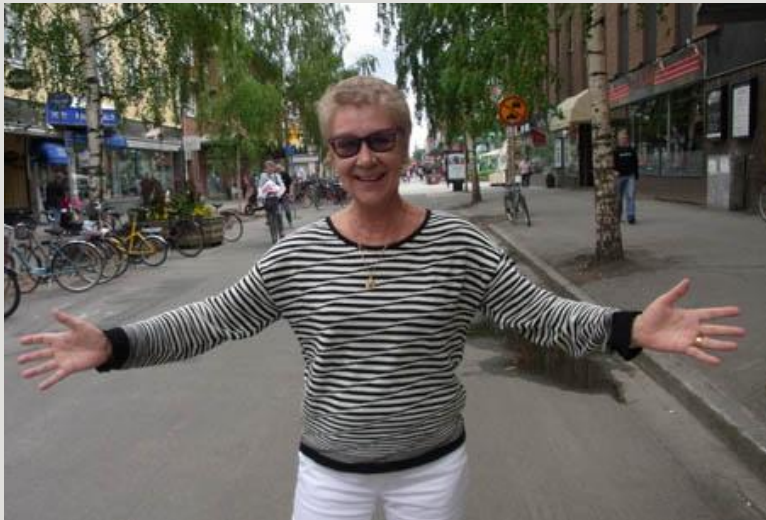
Med Reventberg bjuder in till Norrländsk passion

Arbetet pågår för full med det stora och nyskapande teateräventyret - Norrländsk passion - inför att Umeå blir Europas kulturhuvudstad 2014. De fyra länsteatrarna Norrbottensteatern, Västerbottensteatern, Scenkonstbolaget - Teater Västernorrland, Estrad Norr, Jämtland samt Giron Sámi Teáhter samarbetar för att under maj och juni 2014 ha premiär i Umeå och därefter turnera i hela Norrland.