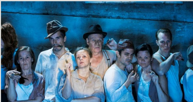
Scenkonst Sörmland och Västmanlands Teater, Den goda människan i Sezuan