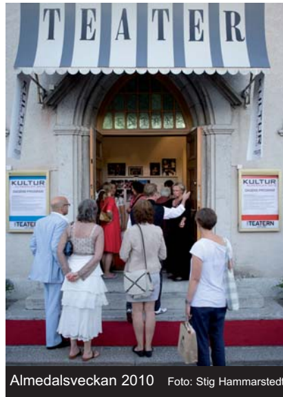
Almedalsveckan 2010

skolan och därmed ett hållbart engagemang för kultur. Scenkonsten bjuder på berättelser som öppnar för igenkännande men som också ställer frågor, problematiserar och öppnar nya världar. Ett möte som kan skapa förståelse och tolerans för andra men också stärka barn och ungas egen självkänsla och delaktighet.