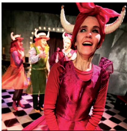
Berättelser för snälla barn Västsvenska Teater och Dans / Älvsborgsteatern 2005

Det har knappast undgått någon att det aviserade barnkulturåret 2007 har ställts in. Men det innebär inte att barn- och ungdomskulturfrågorna har blivit mindre intressanta. Utbildnings- och kulturdepartementet har fått in ca 180 remissvar på Tänka framåt, men göra nu , Aktionsgruppen för barnkulturs betänkande – och fler svar är på väg in. Regeringen har också aviserat att man kommer att återkomma med en mer långsiktig strategi för barnkulturens framtid. Först ska dock remissvaren läsas, kategoriseras och analyseras.